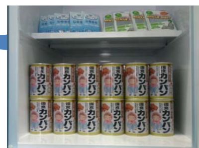
災害対策用備蓄品