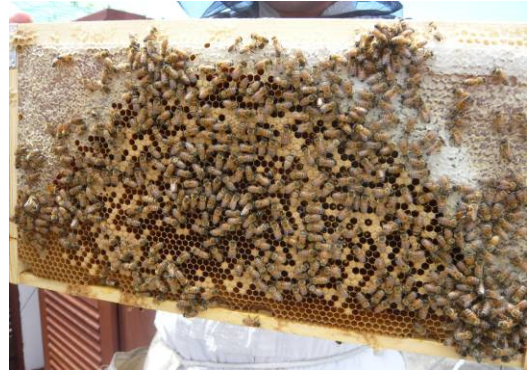
ミツバチの巣箱の様子(10月13日)