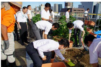
社員参加によるサツマイモのつる入れ作業 (7月15日)