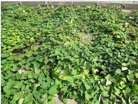
サツマイモの土耕栽培(9月15日)