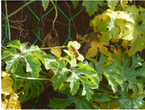
ミツバチによるゴーヤの受粉(10月13日)

当初は在来種である日本ミツバチによる養蜂を計画していましたが、日本ミツバチの確保が困難なため、西洋ミツバチを2群飼育しました。酷暑だった夏でもミツバチは元気に飛び回り、蜜や花粉を集め、屋上で育てているゴーヤの受粉も確認できました。