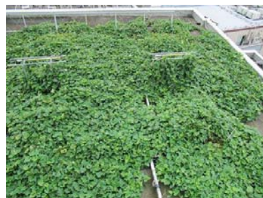
苗の生長状況(9月15日)