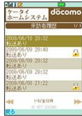
来訪者履歴確認画面