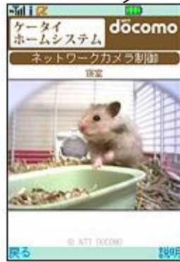
ネットワークカメラ操作画面