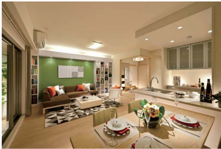
モデルルーム(リビング・ダイニング)

プレッツ光ネクスト マンション・スーパーハイスピードタイプ集の体験コーナー など