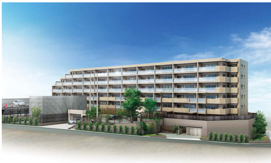
「ウェリス星ヶ丘」外観(完成予想図)

「ウェリス星ヶ丘」マンションギャラリーでは、12月13日(木)より販売を開始します。竣工は2013年8月下旬、入居開始は10月下旬を予定しております。