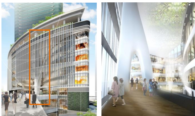
「ウィッシュボーン」（全体、南館5F）