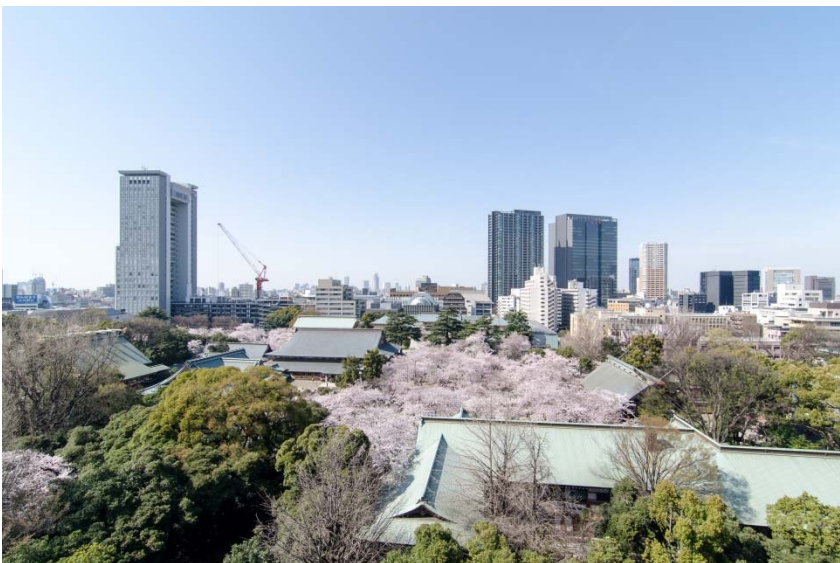
<9階コミュニティテラスから見える開放的な眺望>

HIVEには①ミツバチの巣という意味と②多くの人で賑わっている場所という意味があります。この施設で多くの人が育ち、働きバチとして東京から世界中を行き来し、そして最後には巣立って行くことを願い、HIVE TOKYOと名付けました。