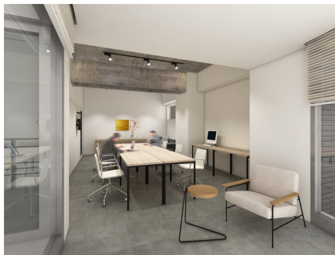
サービスオフィス