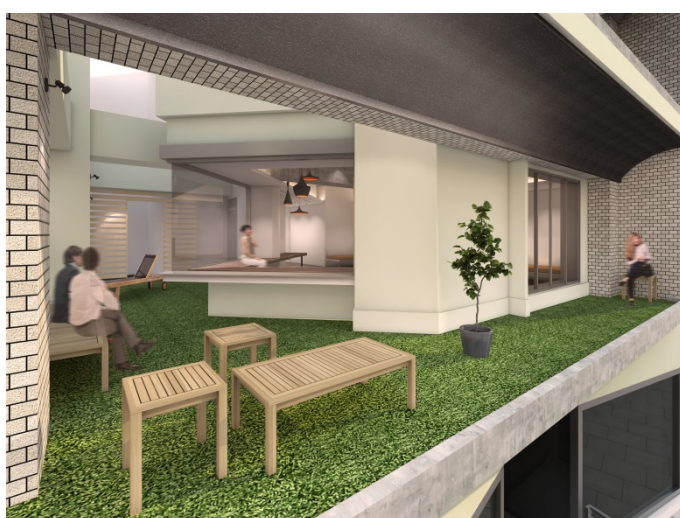
コミュニティテラス