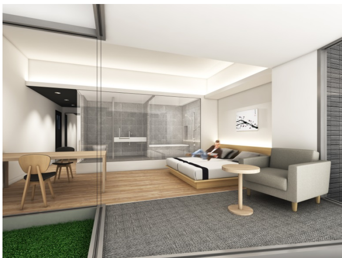
サービスアパートメント