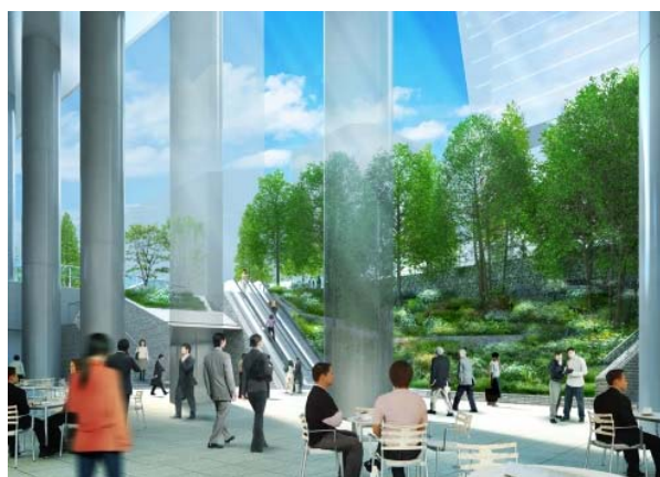
サンクンガーデン(地下1階)