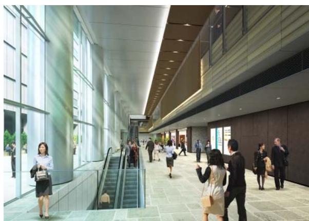
セントラルプロムナード(1階)