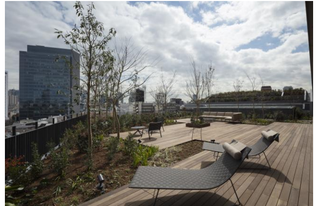
4階テラス（住宅共用部） ※