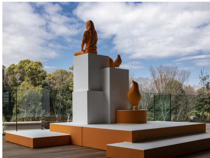
「La Statue de Harajuku」