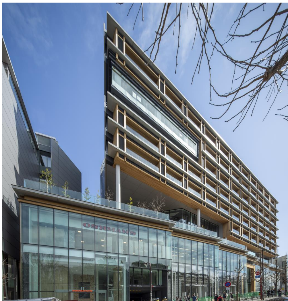
原宿駅側外観（北側） ※

地下2階から地上3階には、多様化したライフスタイルをもつ現代人に向けて、ファッション、フード、ビューティー、ライススタイル雑貨など、常にファッションやライフスタイルのトレンドを発信し続ける店舗をラインナップします。また、3階は原宿における文化発信地の一翼を担うイベントホール「WITH HARAJUKU HALL」とシェアスペース「LIFORK 原宿」、4階以上は賃貸レジデンス「WITH HARAJUKU RESIDENCE」により構成される複合施設となります。