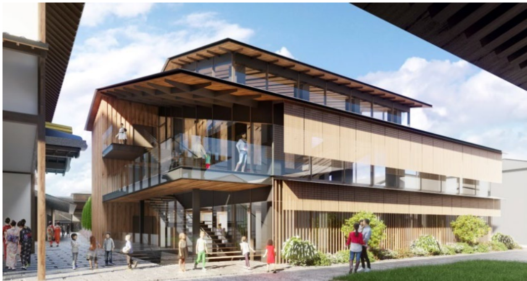
新道自治連合会が利用する多目的ホール(避難所としても活用)・自治会活動スペース(集会所、倉庫等)の整備