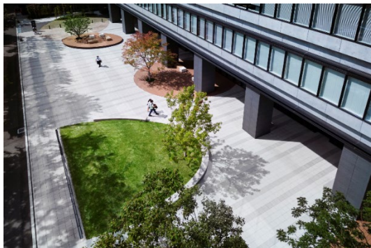
周辺エリアに賑わいを創出する広場（南）