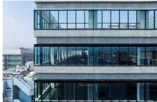
凹凸の梁型と透明感を併せ持つコーナー部のファサード