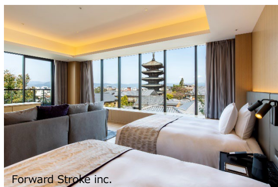
テラスツインパタゴビュー