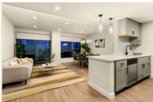
写真① リビングの様子