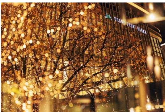
▲「Champagne Gold Illumination」過去開催時(グランフロント大阪・うめきた広場)

今年の冬は、「Champagne Gold Illumination in UMEKITA」で、特別なひと時をお過ごしください。また、2025年春頃にはグラングリーン大阪の南館の開業を控えており、うめきた公園後行工区の工事も進行するなど、ますます進化・拡大を続けるうめきたエリアにご期待ください。