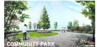
【コミュニティパーク完成予想図】