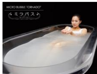
【「ミラブルzero」「ミラバス」を導入（イメージ）】