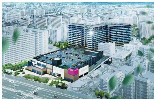
【イオン一体開発（イメージ）】