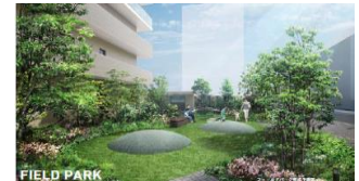
【フィールドパーク完成予想図】