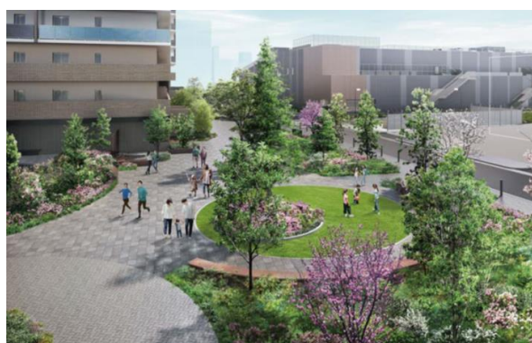
【コミュニティパーク完成予想図】