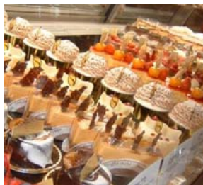
おすすめのスイーツ