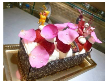
'10 クリスマススイーツ (トランシュ オ フレーズ ローズ)