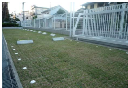
本年度実施の緑化駐車場 (試食会会場)